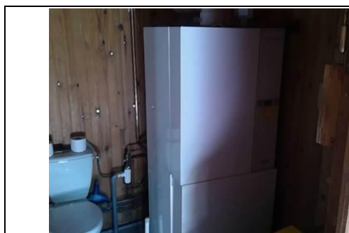
Photo n° PhGaz001 Localisation : Cellier Chaudière WEISHAAPT (Type : Etanche) Localisation sur croquis : 001