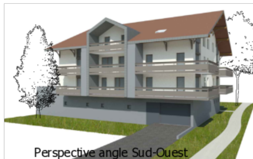
Perspective angle Sud-Ouest