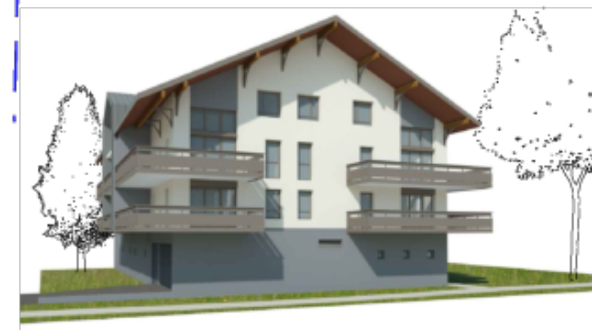
Perspective Pignon Sud