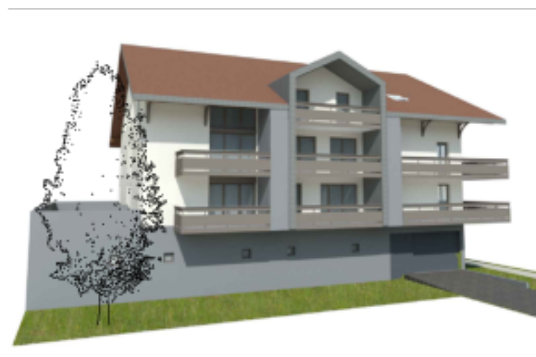
Perspective angle Nord-Ouest