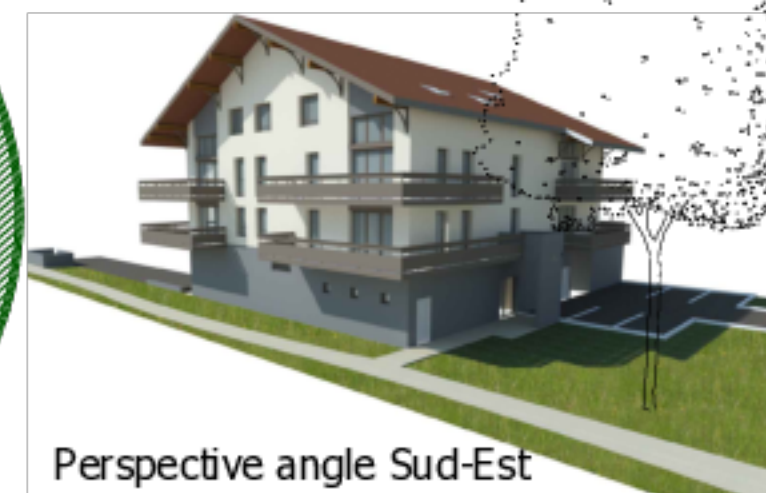
Perspective angle Sud-Est