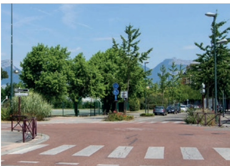
La rue de Normandie Niemen