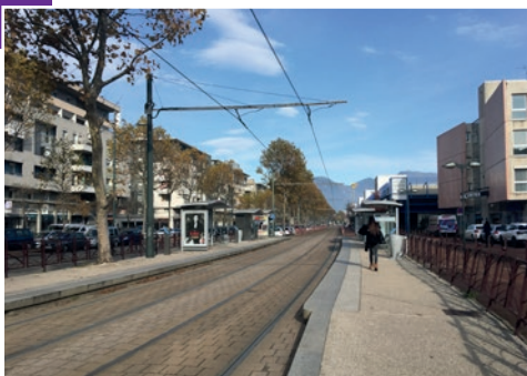
La station de tram Marie Curie