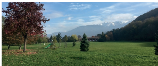
Le parc Robert Buisson