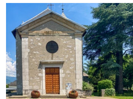
Église de Cognin