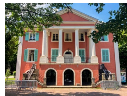
Centre de loisir