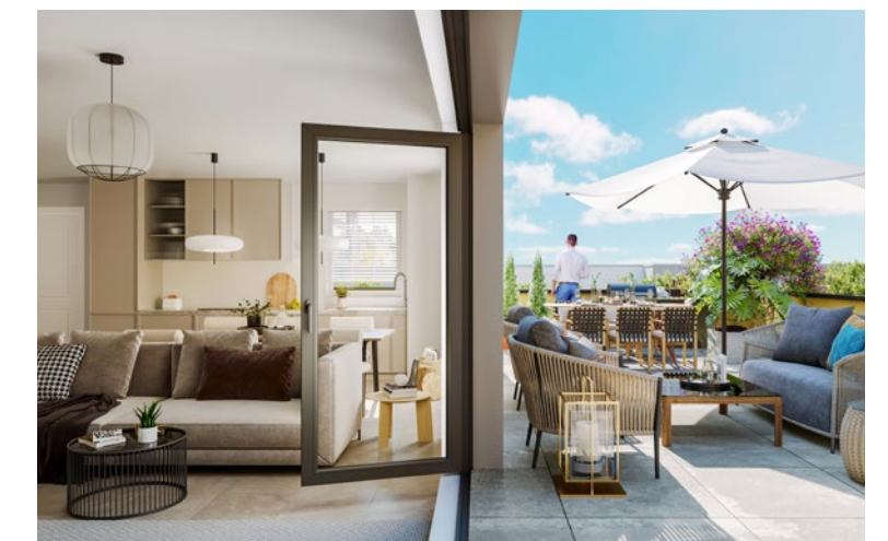
Vue d'intérieur - Photo non contractuelle