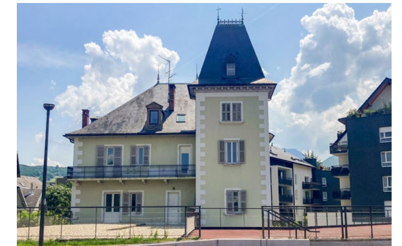
Entrée de ville