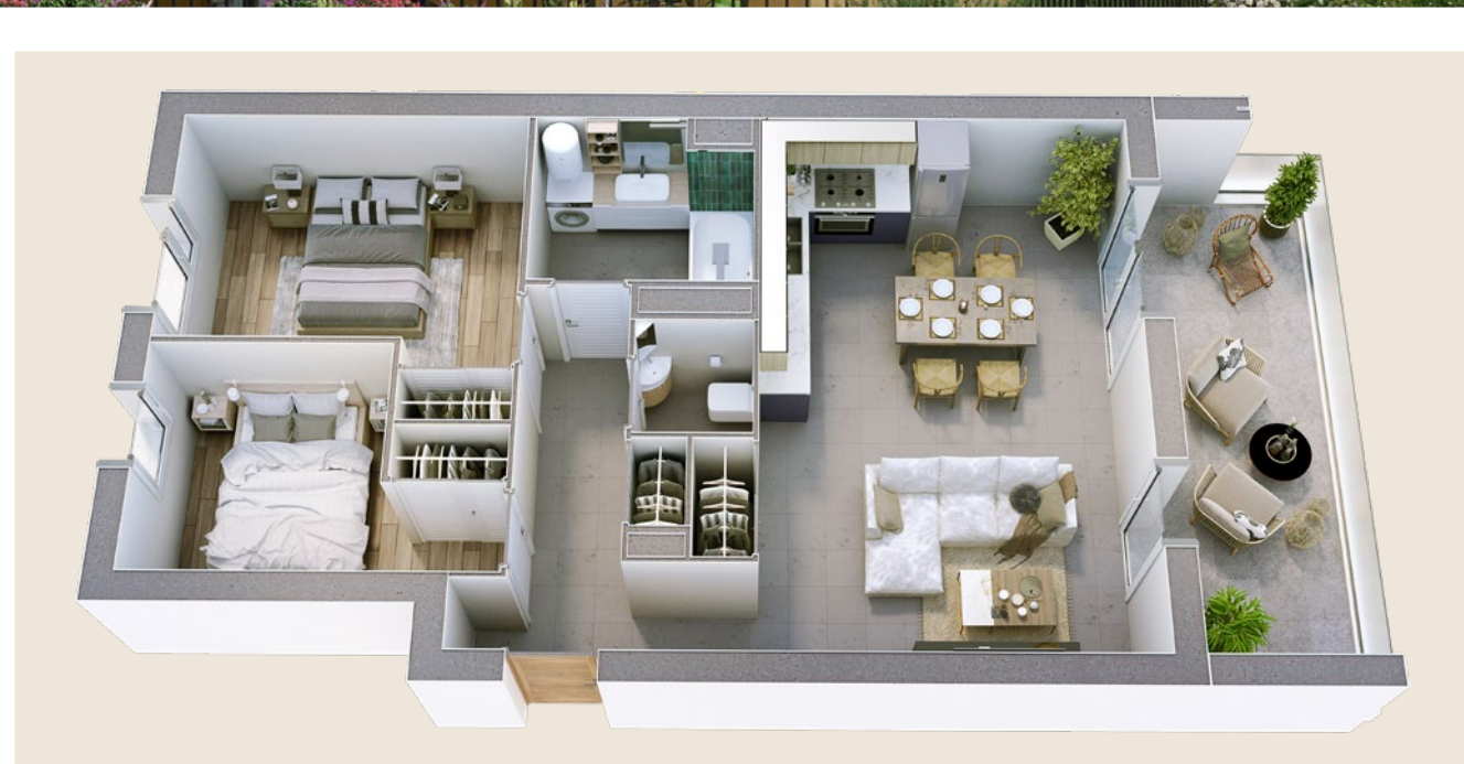
Plan d'appartement type T3 - Photo non contractuelle