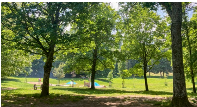
Parc du Forezan

Des volumes équilibrés, une architecture à la fois traditionnelle et moderne avec ses habillages de façades des attiques en zinc, de larges balcons ou terrasses prolongeant de spacieux séjours bénéficiant d'un ensoleillement généreux, en sont les principales caractéristiques.